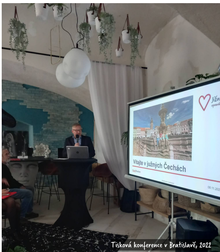
Tisková konference v Bratislavě, 2022