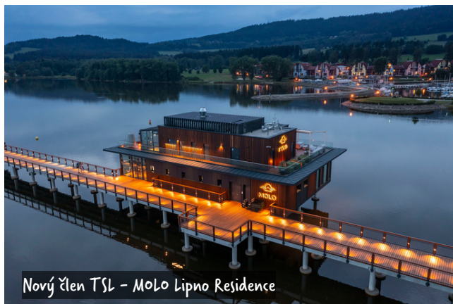
Nový člen TSL – MOLO Lipno Residence