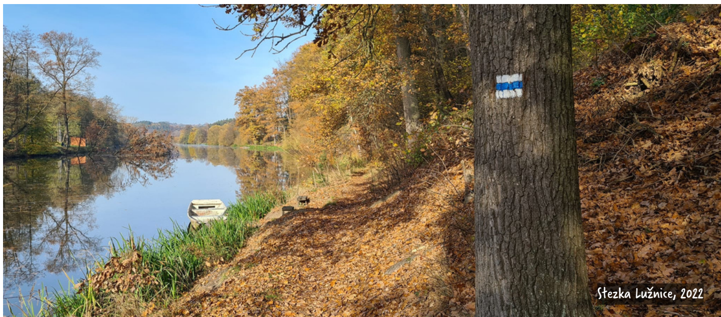
Stezka Lužnice, 2022