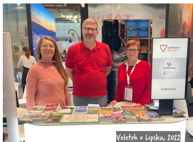
Veletrh v Lipsku, 2022